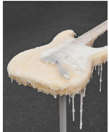
III.2 Charbel-joseph H. Boutros, Waxed Melody, 2022