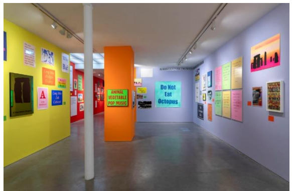
III. 3 Vue d'exposition Jeremy Deller, Warning Graphic Content, galerie Art Concept, Paris, 2021.