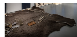
Préhistoire de pierres ragistor ar mein